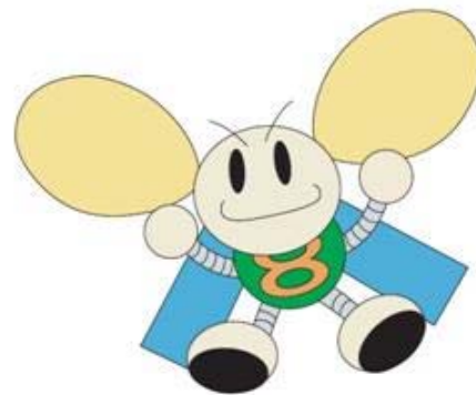
シンボルキャラクター「きくはちぞう」

なお、きく8号(ETS-VIII)は、宇宙航空研究開発機構(JAXA)、独立行政法人情報通信研究機構(NICT)および日本電信電話株式会社(NTT)と共同で開発されました。