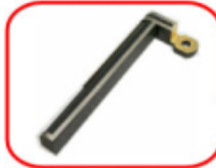
今回携帯電話に搭載されるアンテナ (2バンド用、全長4cm)