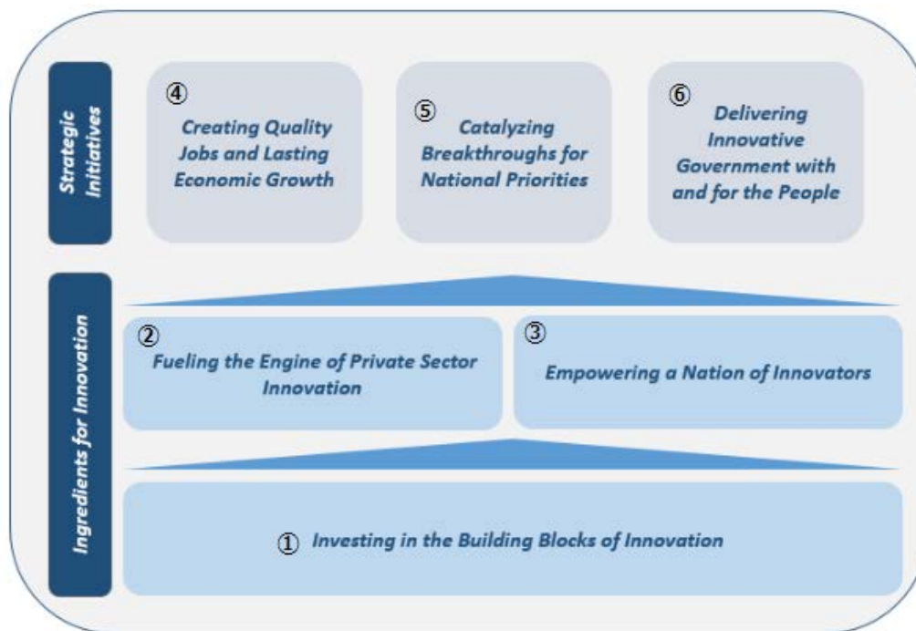
図表 2 2015 年版米国イノベーション戦略の戦略概念図

年や 2011 年に発表されたバージョンと同一でありながらも、民間セクタの原動力に頼りつつも、公共セクタ側でも適切なイニシアティブや政策を打ち立て、イノベーションを促進するという方針が強調された。オバマ政権は、新しく生み出された技術を活用することで、連邦政府の業務パフォーマンスを上げ、効率化すると共に、公共セクタ側でもイノベーションを効果的に後押しできるような環境を整備する方針を打ち出した 5 。