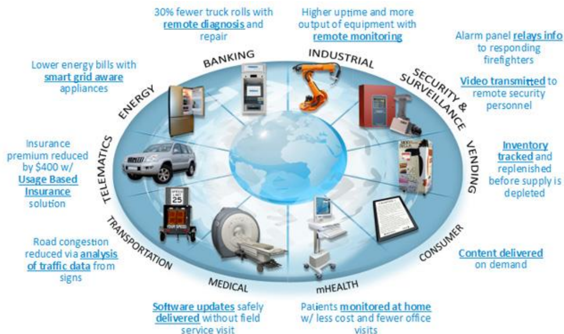
図2 モバイル機器間通信における経済エコシステムの例