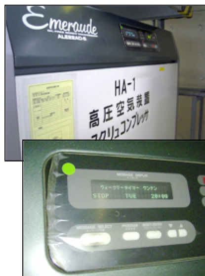
高電力使用装置であるコンプレッサについて、これまでタイマー運転の制御で省エネを図っていましたが、2007年度に向けて、もう一步踏み込んだ制御ができないか検討しました。

施策実行状況については、上記の各施策を5点評価で評価した平均点は4.9点と、良好な結果となりました。