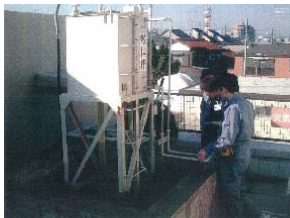
屋上リザーブタンクの確認