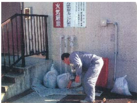
軽油の漏洩を想定した訓練