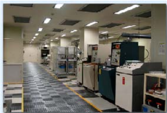
一般プロセス用クリーンルーム

フォトニックデバイスラボは、情報通信研究機構 第一研究部門 新世代ネットワーク研究センターに付属した施設として、部門内の関連研究グループが協力して、運営・維持管理が行われていますが、産学官連携研究を推進する観点から、可能な限り開かれた研究施設として運用する計画です。