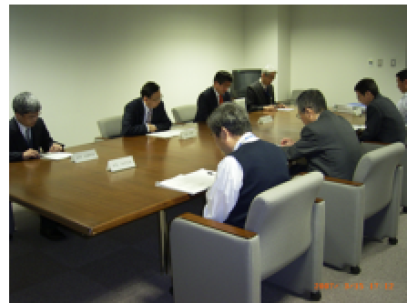
環境マネジメントシステム推進委員会の様子

2006年7月に環境マネジメントシステム推進委員会を設置し、最高責任者はNICT総務系理事、環境管理責任者はラボ総括責任者、環境管理事務局は環境・安全衛生チームをとし、フォトニックデバイスラボの運営管理スタッフ7名をEMS構成員とする体制で運用を開始しました。