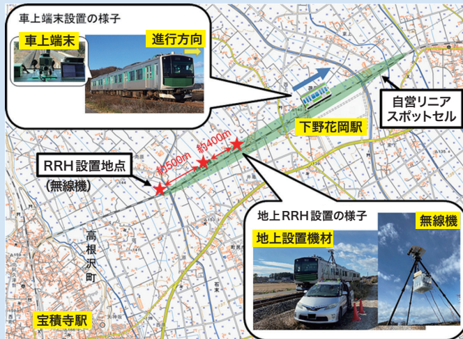
実証実験を実施したJR東日本 烏山線沿線の実験エリアと機材設置の様子 地理院地図(国土地理院)を利用

現在、建物や土地など限定した範囲で自営通信サービスを提供するローカル5Gが注目されています。ローカル5Gでは、サービス提供可能なエリア（セル）が小さいため、全国通信事業者が提供する公衆網に接続された列車や自動車上の端末から自営網への接続遅延が発生すると、そのエリア限定の情報配信を受けられなくなることがあります。